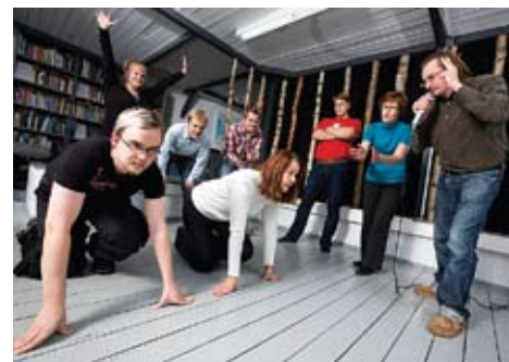
Kajaanin Intotalon opiskelijoita valmennetaan yrittäjyyteen ja myös osuustoimintaan.

Intotalossa on myös yrittäjyyskursseja näille koulutasoille. Projektiopintoja voidaan liittää suoraan osaksi tutkintoa ammattiopistossa, lukiossa, ammattikorkeakoulussa ja yliopistossa.